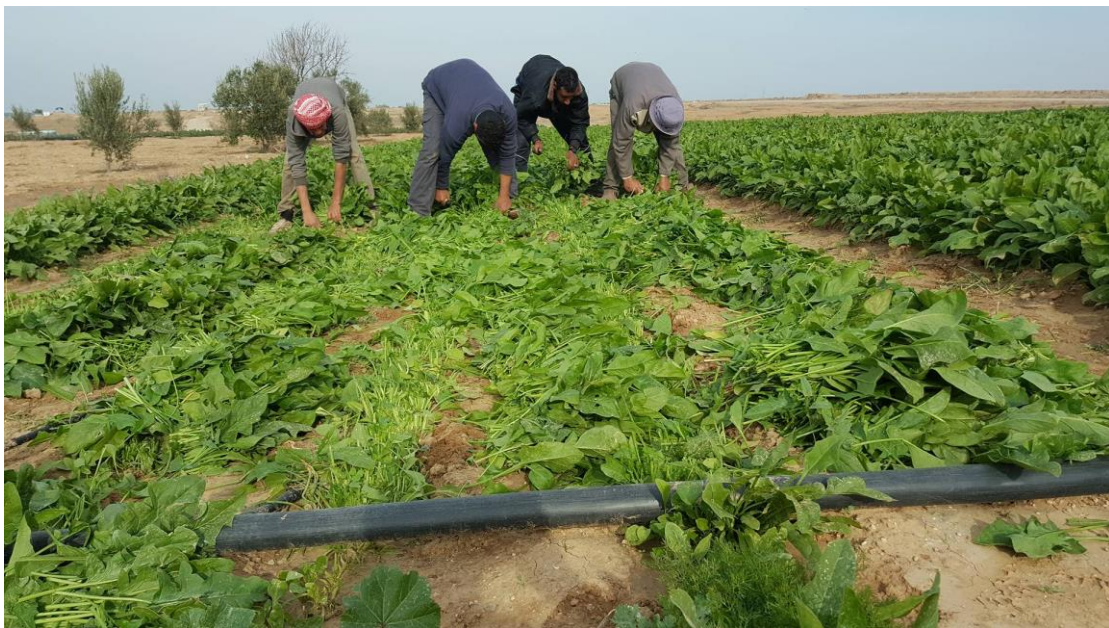
חקלאים אומדים את נזק הריסוס באזור החיץ, ינואר 2018.

השליטה הישראלית סמוך לגדר אינה מסתכמת בירי לעבר חקלאים ואזרחים השוהים בו. בשלהי 2015 אישר הצבא לראשונה שהוא מרסס את השטחים הקרובים לגדר הגבול ברצועה בקוטלי עשבים, כדי להשאיר את האזור חשוף. הריסוס הזה, שקורה כמה פעמים בשנה באזורים שונים ליד הגדר, פוגע ביבולים רבים במרחק גדול מהגדר, ואין לדעת מהם נזקיו לטווח ארוך.