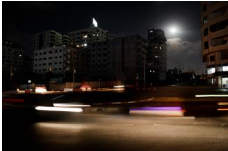
עזה בחשיכה.